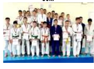
Сборная РМЭ юноши