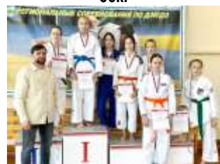
Сборная РМЭ девочки